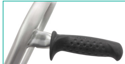
Zusätzlicher ergonomischer Handgriff am Führungsbügel.